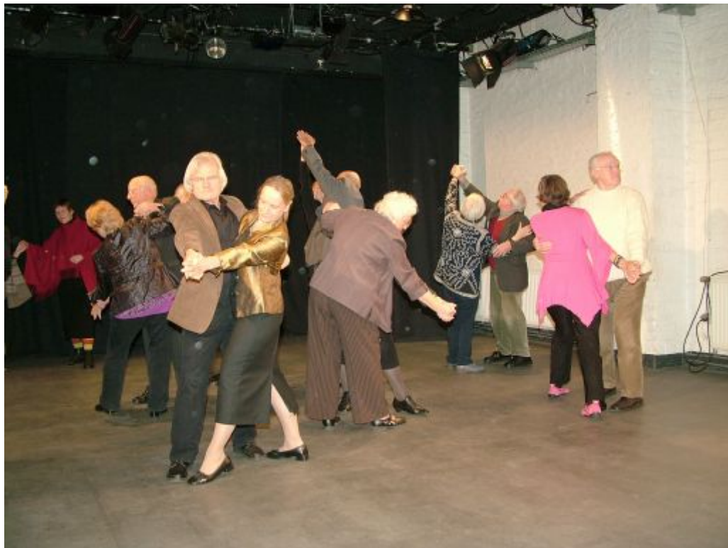
Freies Werkstatt Theater Köln, Jahresempfang der LSV NRW 19.01.2011

Wem samstags 08:05 Uhr zu früh ist, der kann die Sendung auch als Podcast (= eine digitale Mediendatei – entweder Audio oder Video –, die frei aus dem Internet heruntergeladen werden kann) zu einem anderen Zeitpunkt hören! Siehe: www.wdr.de/.../wdr4/.../inunseremalter