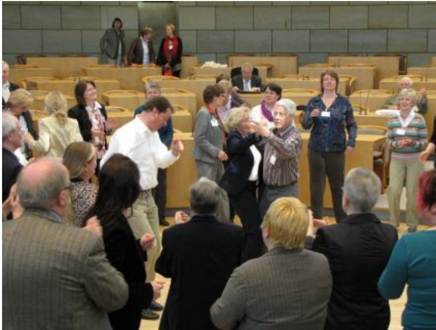
18.04.2011, Tanz im Landtag, im Rahmen der Tagung für und mit pflegenden Angehörigen „Wir leisten viel!“