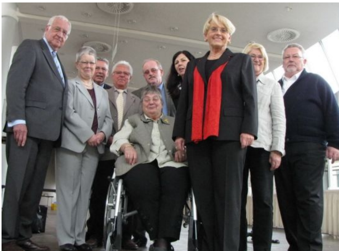
Der Vorstand der Landesseniorenvertretung NRW e. V. und die wissenschaftliche Beraterin, 2011