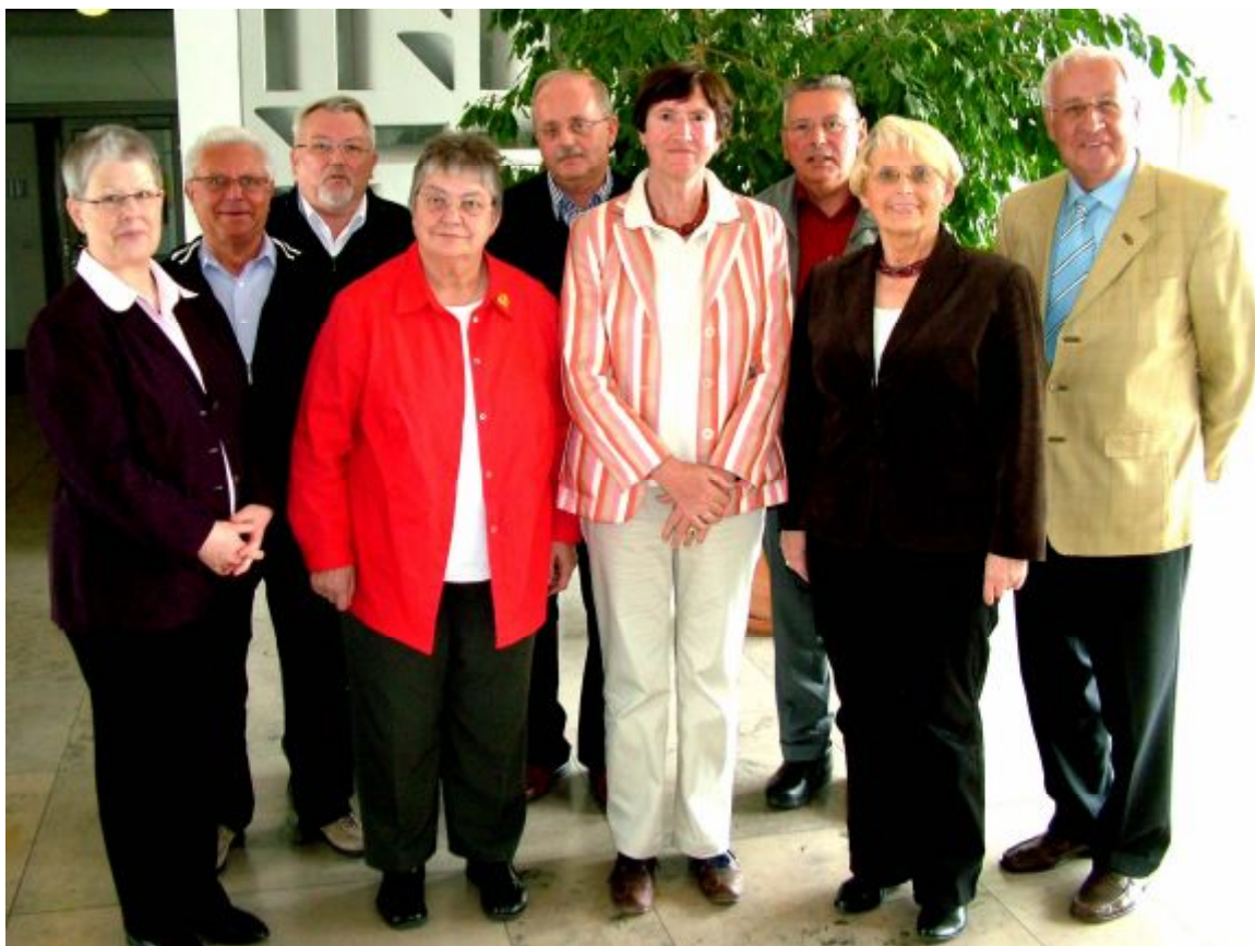
Der Vorstand der Landesseniorenvertretung NRW. e.V.