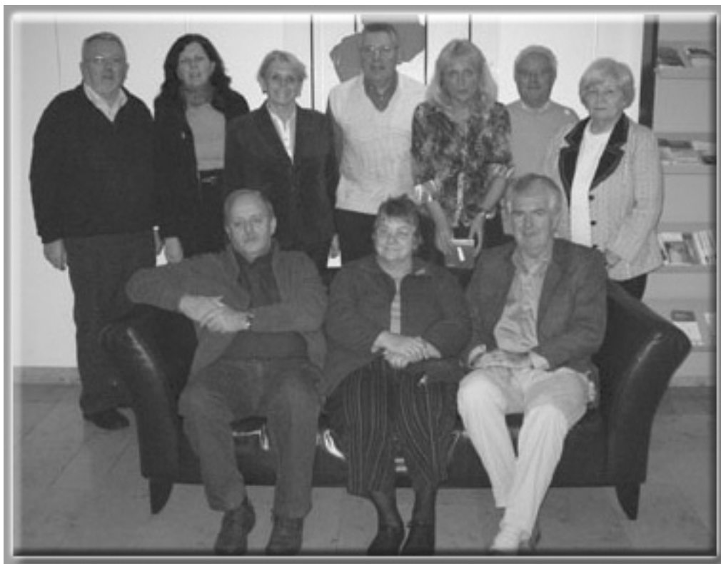
Der Vorstand, die wissenschaftliche Beraterin und die Mitarbeiterin der Geschäftsstelle bei der Klausurtagung in Hattingen.