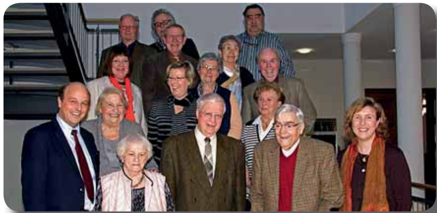
Der Seniorenbeirat der Stadt Detmold im Jubiläumsjahr.

Die wichtigsten Themen sind Wohnen, Versorgung, Pflege, Krankheit im Alter und Vorsorge, Patientenverfügung, Vormundschaft, Vererben. Zur