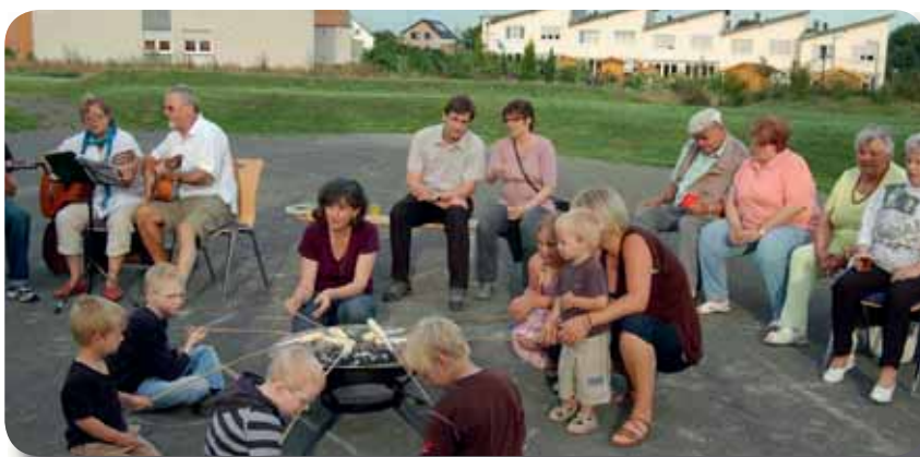
Stadtteilstift in Hohenhagen: Gelingendes Angebot im Modellprojekt.

Unsere Autorin ist Christiane Grabe, Koordination WohnQuartier 4 Diakonie Rheinland-Westfalen-Lippe e.V. www.wohnquartier4.de