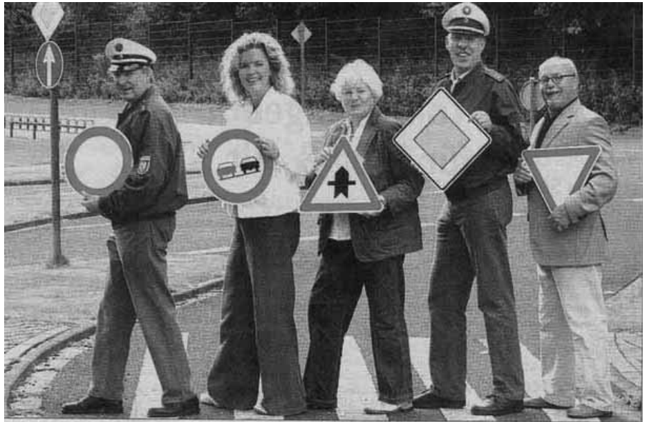
Lehrreich für Jung und Alt: Der Verkehrssicherheitstag in Lünen für Kinder, Jugendliche, Seniorinnen und Senioren.

Seit Januar 2008 besteht diese Einrichtung. Zwischenzeitlich konnten mehrere „junge Alte“ vermittelt werden, zum Beispiel zum Vorlesen in Kindergärten und Grundschulen, als Leih-Oma in einer Familie mit kleinen Kindern, die keine Großeltern mehr