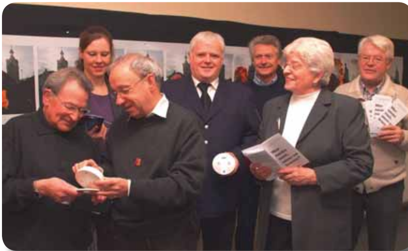
Eine gute Idee: Gemeinsam stellten in Iserlohn Mitglieder des Seniorenbeirates, der Feuerwehr, des ehrenamtlichen Dienstes und der örtlichen Presse die Rauchmelder-Kampagne vor.