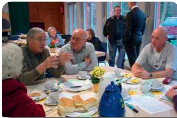
Senioren in Troisdorf diskutieren über die Zukunft ihres Quartiers in Altenforst.

Durchführung eines Themenworkshops unterschiedliche Gruppen an den Themen Intergenerativer Freizeitpark, generationsübergreifendes Kulturprojekt und generationsübergreifendes Wohnen. Zugleich wird versucht, die unterschiedlichen und vielfältigen Aktivitäten der Stadt Berg-